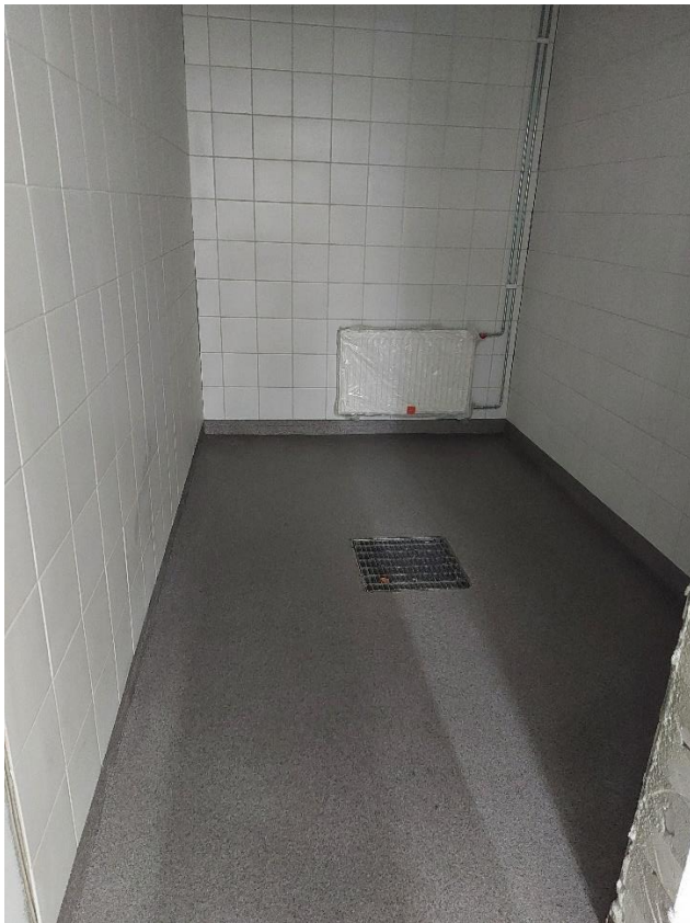
Valmis akryylipinta märkätilassa