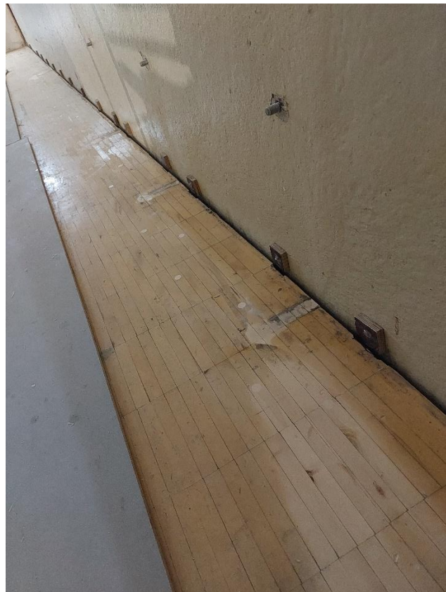
Liikuntasalin lattian ummistus vanhoja lattiaanaloja käyttäen