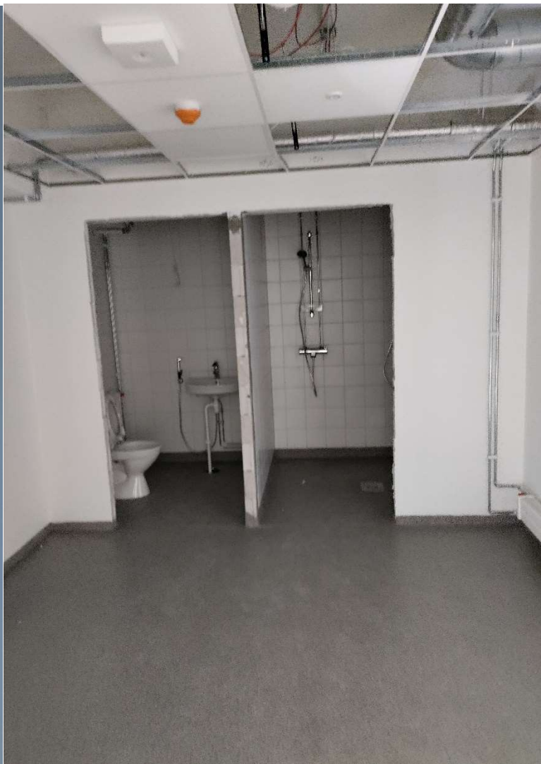
Yläkerrasta ensimmäinen huone laatassa