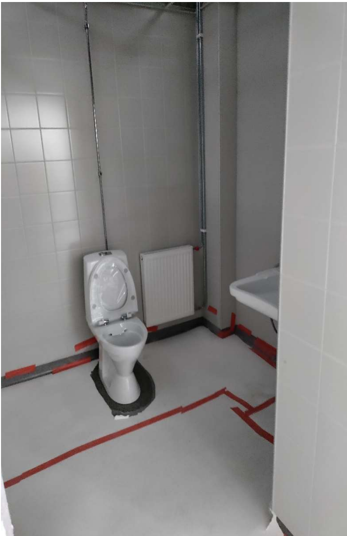
Wc tilojen varustelut on liikkeellä